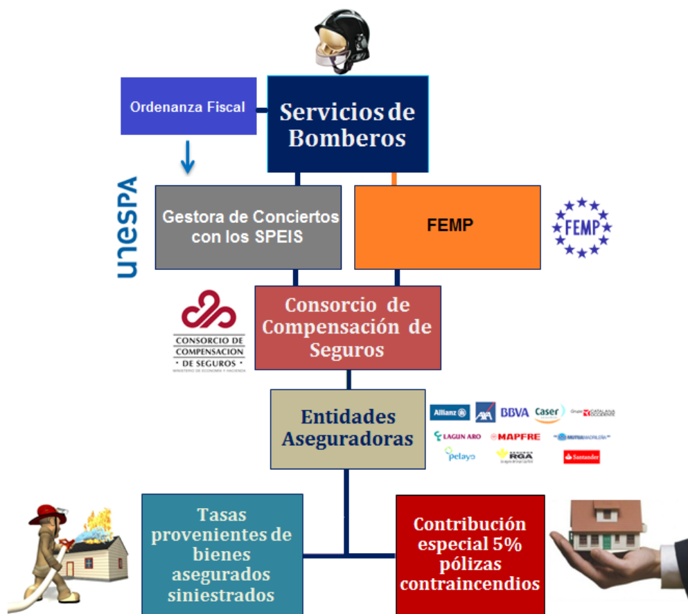
Contribuciones especiales en los SPEIS

La contribución de los seguros contraincendios no incluye todo tipo de pólizas, sino sólo aquellas del ramo 8, (Incendios y elementos naturales), previsto en artículo 6 del texto refundido de la Ley de ordenación y supervisión de los seguros privados, aprobado por Real Decreto Legislativo 6/2004, de 29 de octubre, y se refiere a bienes que no supongan vehículos terrestres, ferroviarios, aéreos, marítimos, lacustres o fluviales o seguros sobre mercancías. Es decir, se trata únicamente de seguros contraincendios sobre bienes inmuebles, ya sean viviendas o industrias.